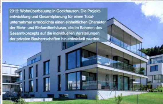
2012: Wohnüberbauung in Gockhausen. Die Projektentwicklung und Gesamtplanung für einen Totalunternehmer ermöglichte einen einheitlichen Charakter der Mehr- und Einfamilienhäuser, die im Rahmen des Gesamtkonzepts auf die individuellen Vorstellungen der privaten Bauherrschaften hin entwickelt wurden.