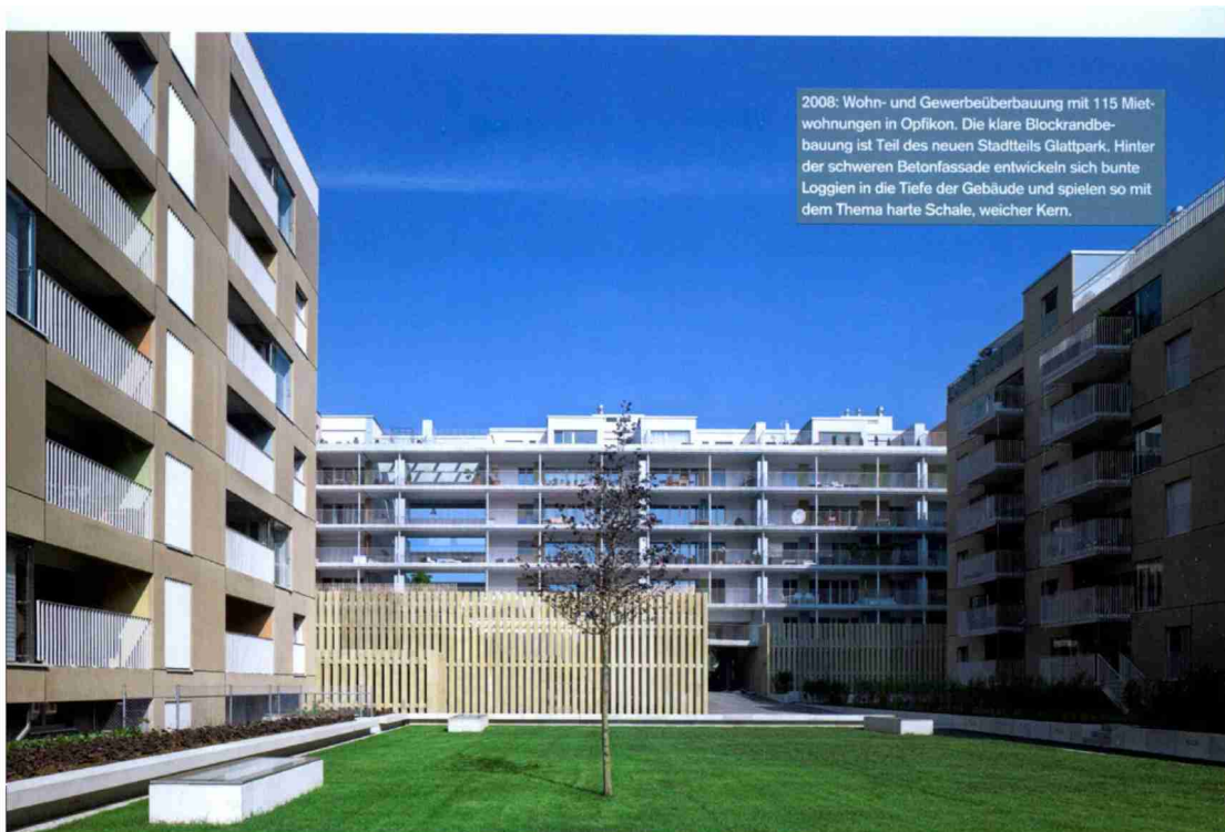
2008: Wohn- und Gewerbeüberbauung mit 115 Mietwohnungen in Opfikon. Die klare Blockrandbebauung ist Teil des neuen Stadtteils Glattpark. Hinter der schweren Betonfassade entwickeln sich bunte Loggien in die Tiefe der Gebäude und spielen so mit dem Thema harte Schale, weicher Kern.

Themen-Nr.: 775.2 Abo-Nr.: 1085043 Seite: 54 Fläche: 78'471 mm 2