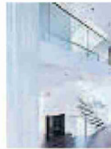
Felix Partner (Hrsg.), Swiss Housing Projects, Niggli-Verlag, Sulgen, 380 S., 330 Abb. und Pläne, Fr. 88.-.