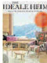
Das ideale Heim – Magazin für Architektur, Design und Wohnkultur, Archithema-Verlag, Zürich, monatlich, im Abo und am Kiosk, Fr. 9.50.